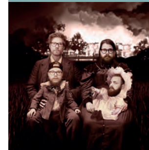
SISTA DROPPEN KL. 21.15