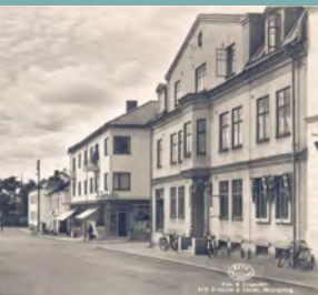
FOTOUTSTÄLLNING GAMLA ÄLMHULT