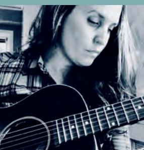
MAGPIE KL. 19.30