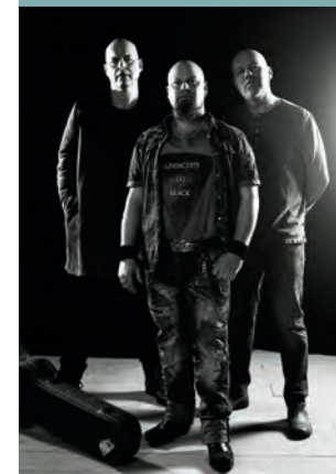
INDEED KL. 19.15