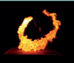
FAVILLA KL. 22.30