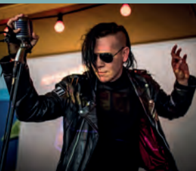
MASKINPOP KL. 22.45