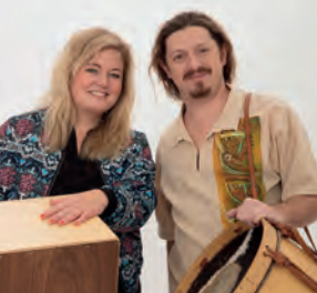
TRUMATTACK KL. 17.45 OCH 20.00