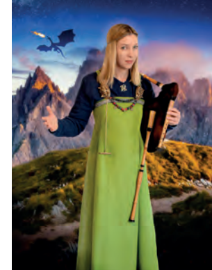
SIGRID OCH DRAKEN KL. 17.20 OCH 20.00

Kl. 23.15. Final Days Society. Ett indie-/post-rock-band från Växjö som bjuder på dynamisk, känsloladdad och storslagen musik. Albumet "Ours is not a caravan of despair" utsågs till ett av årets bästa album 2011 av Joyzine. Dessutom fick låten "60" agera soundtrack i kortfilmen "Prinsen" med Adam Pålsson. Bandet släppte sitt tredje album "Ice-breaker" i mitten av 2015 och har sedan dess hunnit göra spelningar både i Sverige och runt om i Europa. Första gången på scen i Älmhult spelar de intensiv postrock som inte lämnar någon oberörd. Missa inte chansen att uppleva Smålands alldeles egna wall of sound! Music. Arr: ABF