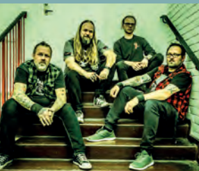
THE DRYHEAVES KL. 19.00