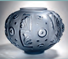
HAR DU EN SKATTGÖM- MA? KL. 17.00–20.00