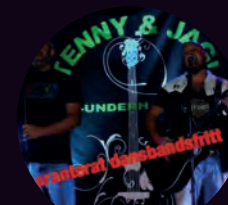
TENNY & JAG UNDER ANTARCTISKA BANDSFRITT

Psst! Du vet väl att du kan lyssna på de flesta artisterna via länkar på almhult.se/kulturnatta