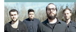
FINAL DAYS SOCIETY KL. 23.15