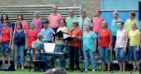
ELMEKÖREN KL. 17.00